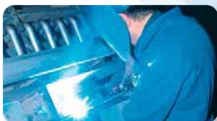
Réparation et maintenance